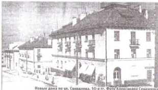
Новые дома по ул. Свердлова. 50-е гг.