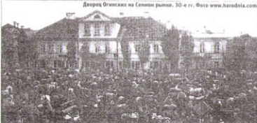
Дворец Огинских на Сенном рынке. 30-е гг.

математикам (архитектору эту улицу обособленная часть здания, сильно выступающая наружу за плоскость стен – прим. авт.) по углам. Главный фасад двора выдвинулся на Сенной рынок. Сегодня это север застывшей «Неман». На второй этаж дворец выла двухмаршевая парадная лестница. Там были заль, комнаты, кухня. Основной этаж здания был накрыт высокой четырехэтажной черепичной крышей.